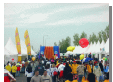
Le village de la course